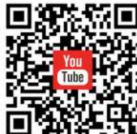
QR-Code für das Mitsing-Video: "Ein Kind verändert die Welt"