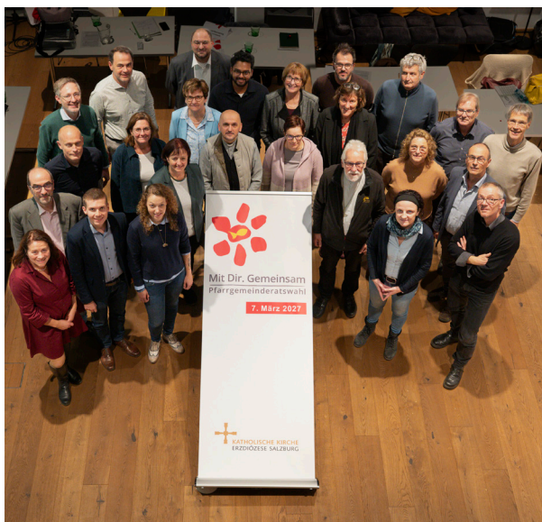
Teilnehmer:innen des PGR-Studientages 2025 PGRÖ

Rückblick, Austausch, Perspektiven und inspirierende Glaubenserfahrungen