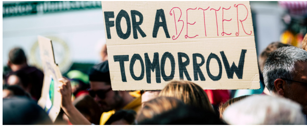
For a better tomorrow

Mit der neuen Initiative #politisch.sein setzt das Forum Katholischer Erwachsenenbildung ein deutliches Zeichen für die Bedeutung politischer Bildung als kirchlichen Auftrag.